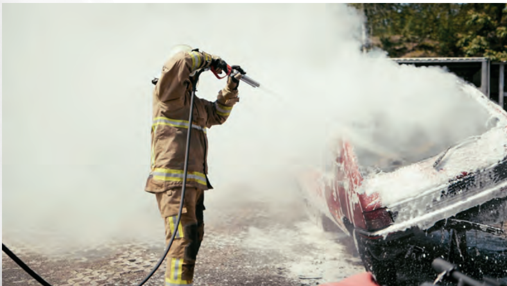
Barracuda DS bei der Brandbekämpfung

Die Steuerung ist so konzipiert, dass das System leicht von einer einzelnen Person bedient werden kann.