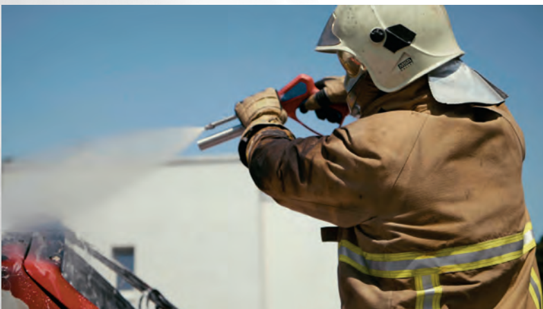
Sprühfunktion der Barracuda DS

Die Barracuda DS wird auch zur Reinigung von z.B. Fahrzeugen verwendet. Der hohe Druck und die Möglichkeit verschiedene Reinigungsmittel beizumischen, ermöglichen eine effektive Säuberung größerer Oberflächen und Objekte.