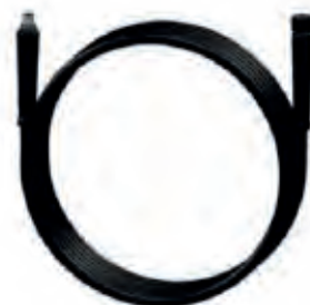
Hochdruckschlauch 10 m / 20 m / 30 m (max. 400 bar)