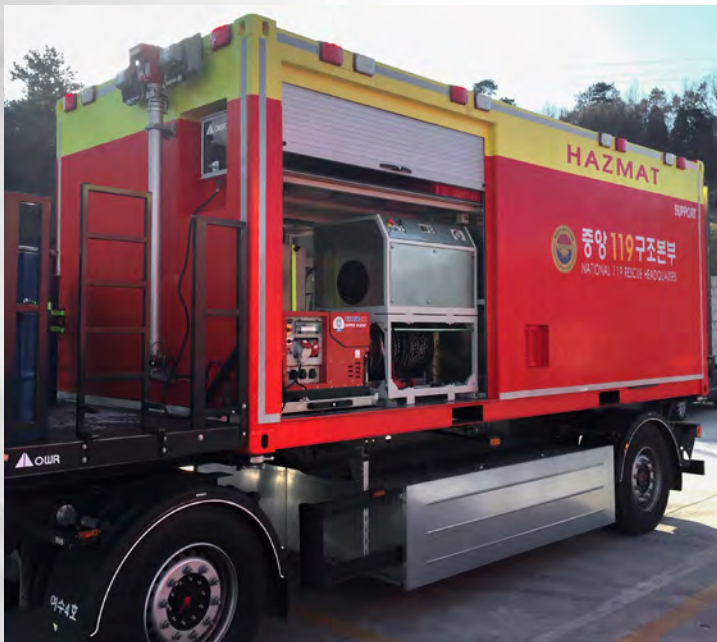
MFU DS beim Korean Fire Department

Wenn reines Wasser zur Beseitigung nicht genügt, können verschiedene Desinfektionsmittel und -konzentrate eingesetzt werden.