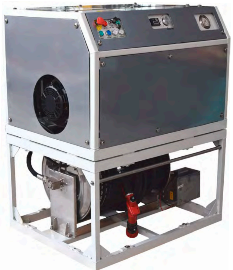
MFU DS mit automa- tischer 60 m Haspel

Es ist so konzipiert, dass es von einer einzelnen Person bedient werden kann.