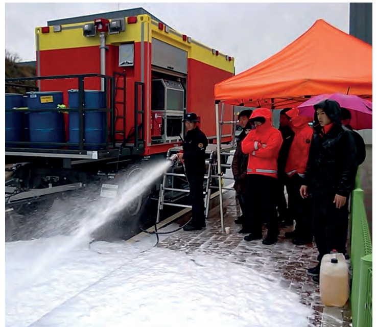
Erzeugen eines Schaumteppichs mit der MFU DS