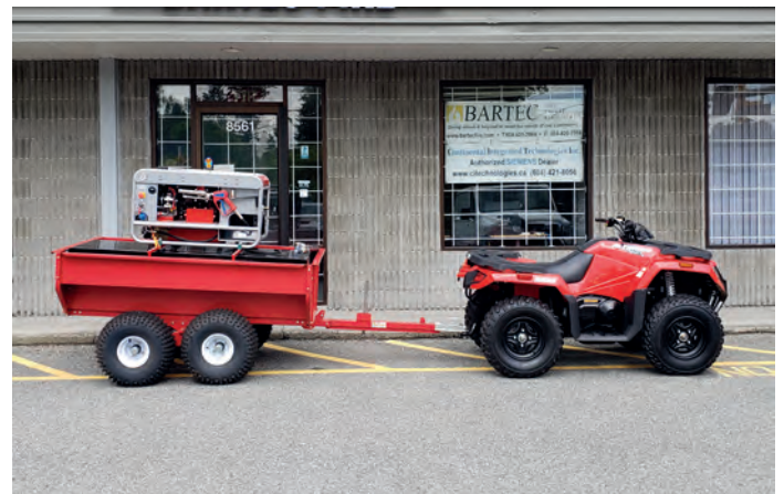
Kompakter Aufbau auf Anhängern eines Quads